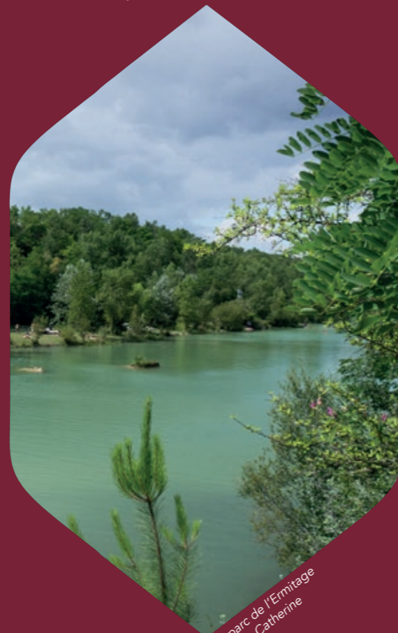
Le parc de l'Ermitage Sainte-Catherine