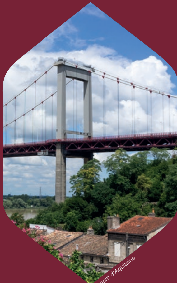
Le pont d'Aquitaine

Entre coteaux verdoyants et berges aménagées, on y vit pleinement la ville sans renoncer au calme. Ici, on grandit, on travaille, on se retrouve. Une ville vivante à la croisée des envies urbaines et des besoins quotidiens.